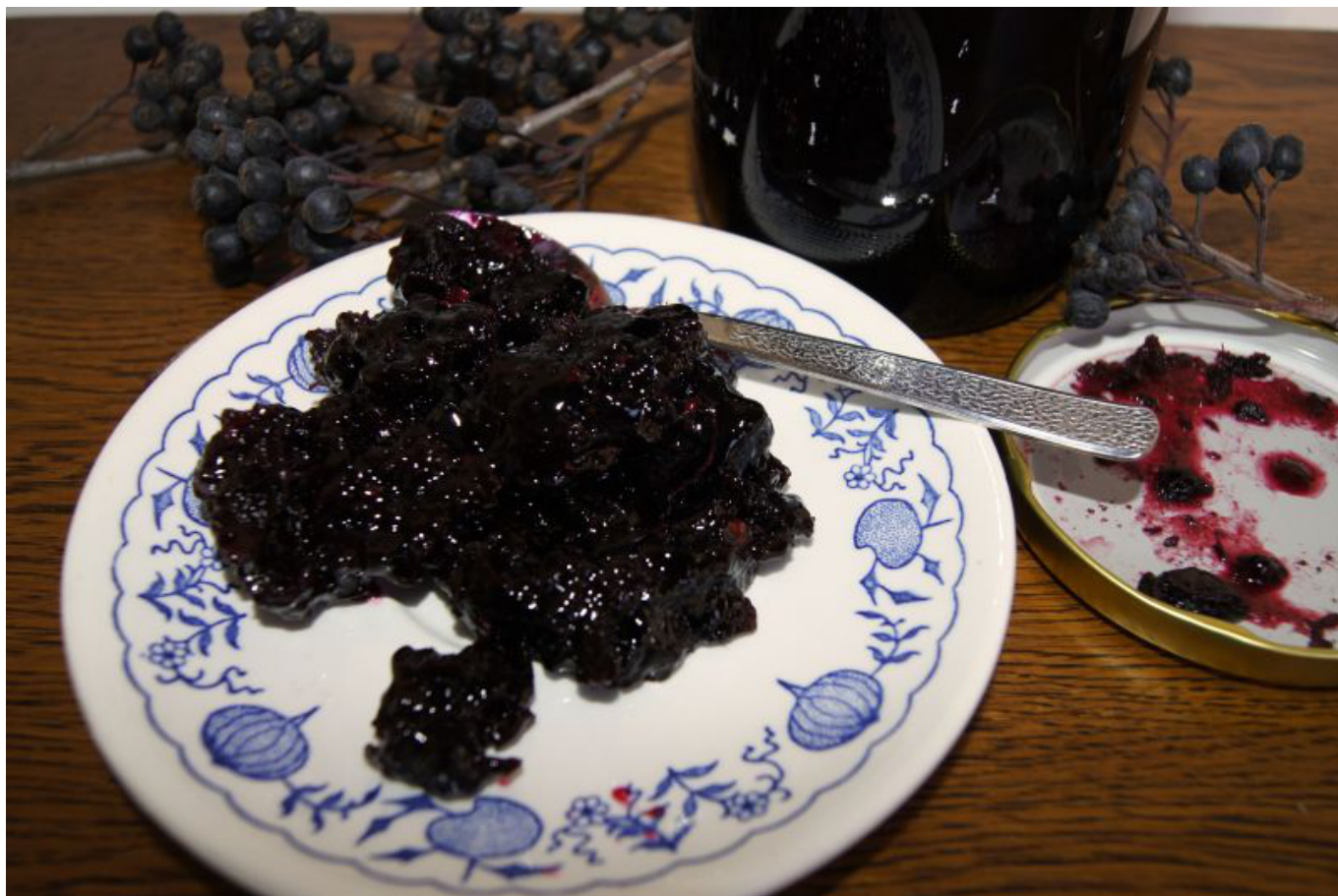
Aronie černá zpracovaná na způsob brusinek