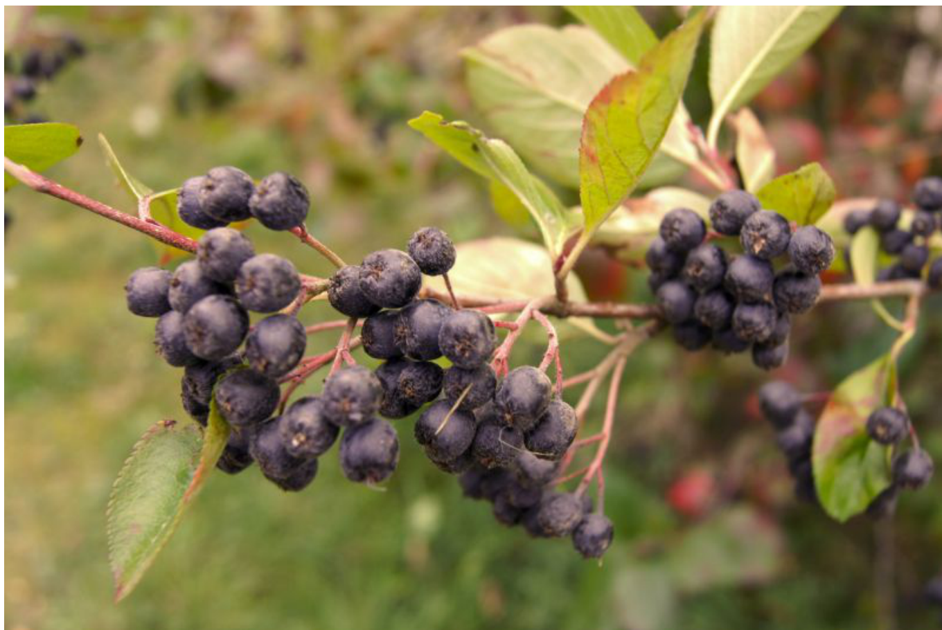
Aronie černá neboli černý jeřáb