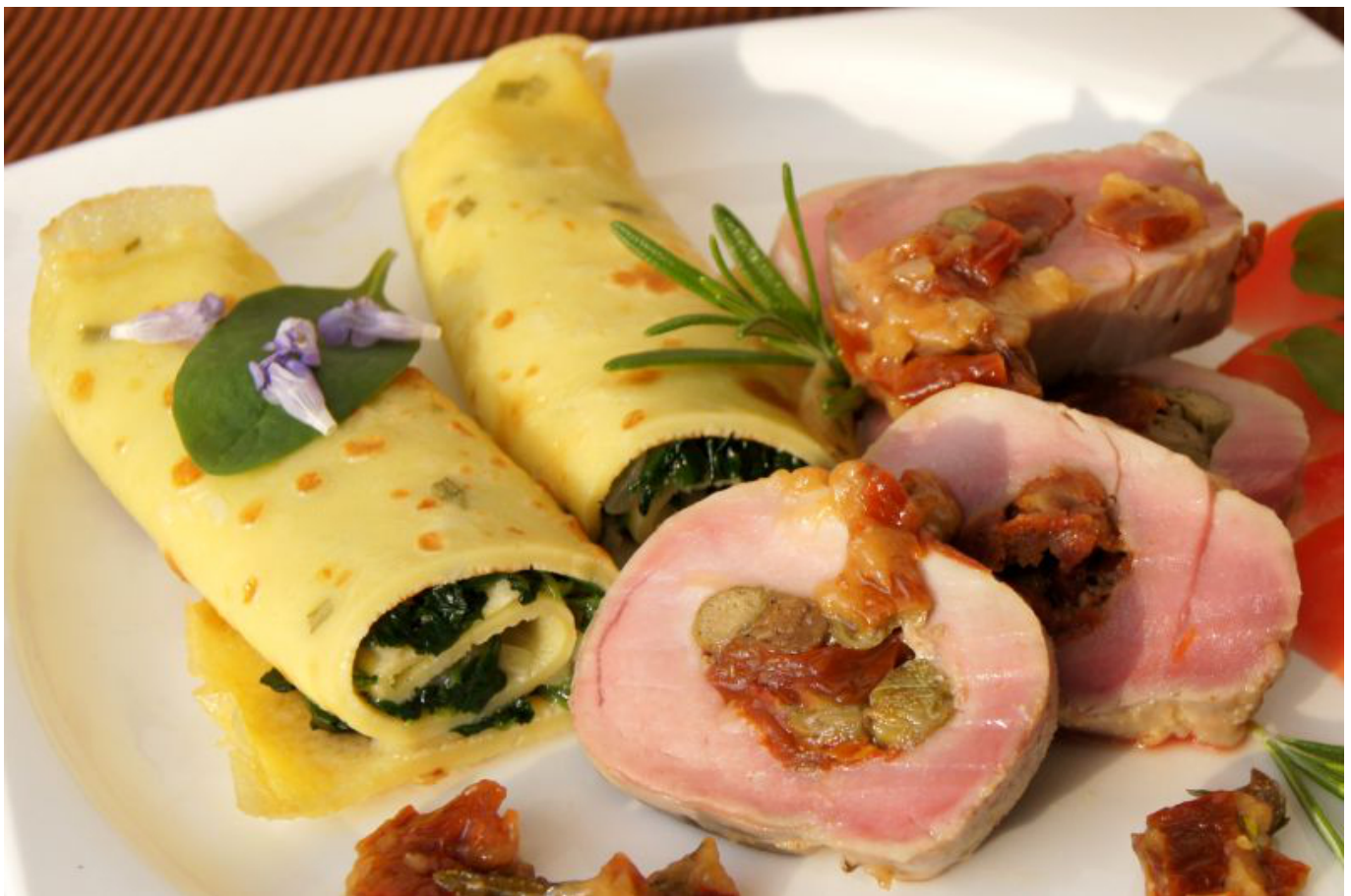
Kapusta kadeřavá v rizoletách k plněné vepřové panence

V kuchyni se z kadeřávku připravují zejména chutné polévky , rizota, zapečená masa, zeleninové saláty, hojně je využíván i k těstovinám. Jako příloha, např. s vepřovou panenkou, chutnají skvěle rizolety plněné kadeřávkem.